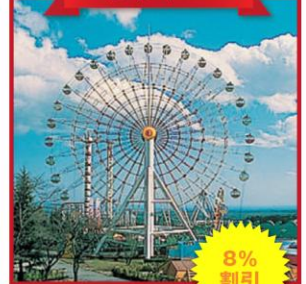
全国共通ゆうえんち券