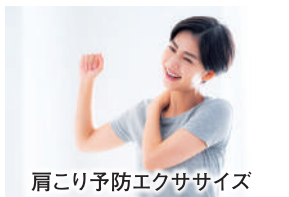
肩こり予防エクササイズ