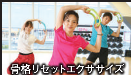
骨格リセットエクササイズ