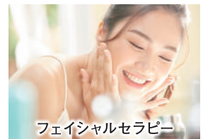
フェイシャルセラピー